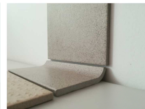
DETAIL IZVEDBE STIKA STENSKE IN TALNE KERAMIKE - TALNA KERAMIKA Z ZAOKROŽNICO